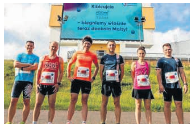
Każda drużyna wyznaczała swój start i metę, ale wszystkie musiały trzymać się zasad - dystans 42,2 km musiał się zgadzać