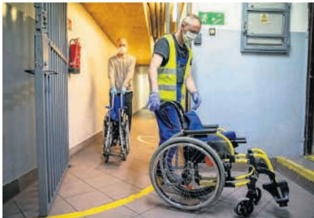
Wczoraj osadzeni przekazali dwa wózki. W planach są kolejne. Służba więzienna deklaruje, że chętnie wyremontuje też rowery

Dowiedział się o programie resocjalizacyjnym „Tacy sami za kratami” prowadzonym w zakładzie karnym przy ul. Hetmańskiej. Firma uznała, że pojazdy nadają się do remontu i mogą jeszcze komuś posłużyć.